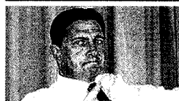
Reciklaža: Borut Pahor [1]