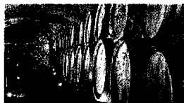
Uvod v poletno lahkotnost