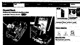
Opazili s(m)o: Kristalni polnilni podstavek v ugledni spletni reviji [2]