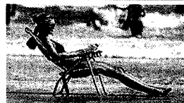
Svetujemo, da si na počitnicah ne bi pullili las