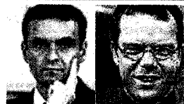
Slak in Traven podpisala pogodbo z RTV [16]