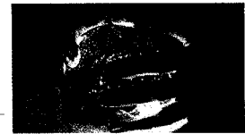
Hrvaška astrologinja: referendum bo uspel [26]