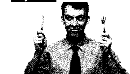
Kam danes na kosilo v Ljubljani