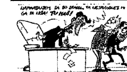
Karikatura dneva [1]