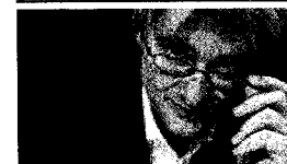
Bivši šef YLE imenovan za generalnega sekretarja socialnih demokratov [10]