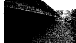
Dilema: nakup ali najem garaže?