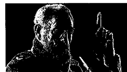
Castro: koka je v Južni Ameriki kot čaj v Angliji [4]

V drugi polovici leta se bomo širili na tuje trge, saj smo te načrte zaradi krize v preteklosti upočasnili. Pričakujemo manjšo rast prihodkov, a zato dolgoročneje toliko stabilnejšo. Vse naše rešitve Inrix temeljijo na spletu, tako da v prihodnje poleg stalnega razvoja največ aktivnosti načrtujemo na področju spletnega trženja, saj lahko iz naših poslovnih prostorov izpeljemo projekt kjerkoli na svetu. Razvojne in prodajne strategije bomo pripravljali v skladu s tehnološkim napredkom in svetovnimi smernicami v uporabi spletnih aplikacij."