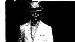
Vse je spet vitko