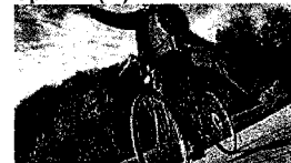
Na policijski dražbi v Ljubljani večinoma kolesa